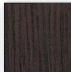
Chêne de Fil Brun (16)