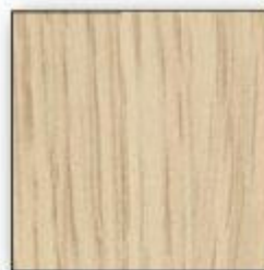
Chêne de Fil Naturel (17)