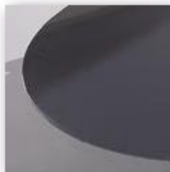
Verre Graphite (V03)

■ Stratifié sur médium : épaisseur 30 mm, chant aile d'avion inversée avec chant droit PVC 2 mm coordonné.