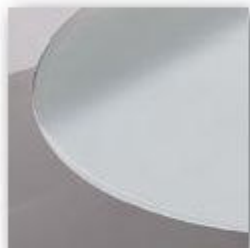
Verre Opalit (V04)